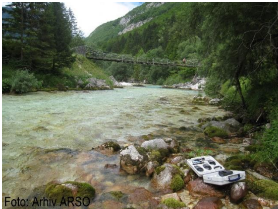
Slika 2: Vzorčenje fitobentosa na reki Soči.